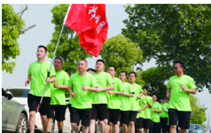
航埠分会场,50名“航锋跑团”成员沿常山港开启慢跑两公里活动。