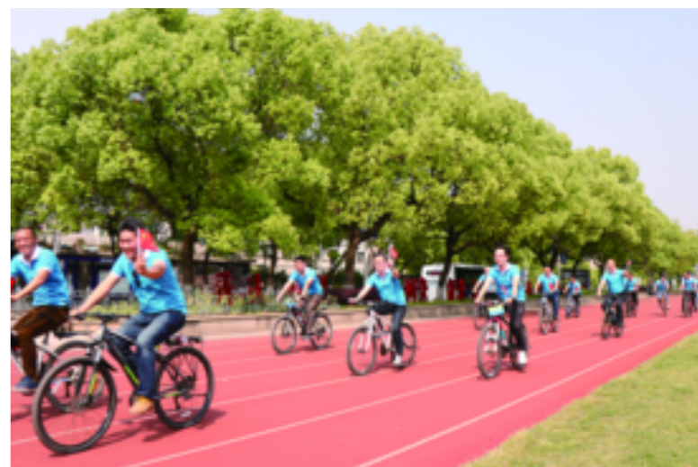
衢化分会场,衢化街道机关干部一起骑行。