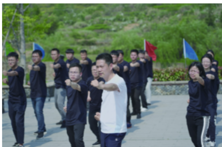
石梁镇分会场,40名镇干部在麻蓬村金庸文化广场一起练习麻蓬十三太保拳。