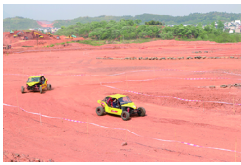
精彩刺激的运动汽车体验活动