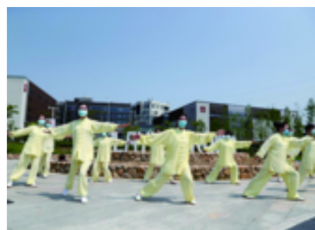
主会场一派火热的运动场景

4月17日下午,“运动柯城”全民健身活动云启动仪式在鲛鱼湾乡村国家运动公园举行。万田主会场和14个乡镇街道分会场相继开展太极拳、十三太保拳、围棋等极具柯城特色的运动项目,掀起全民健身热潮。现撷取活动精彩瞬间,以飨读者。